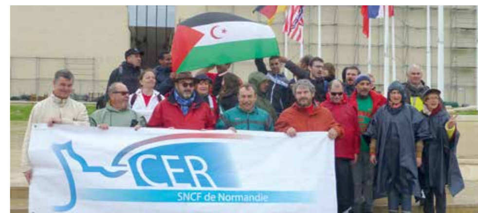
Mai 2014 : la « caravane franco-sahraouie » devant le Mémorial de la paix à Caen.

Actuellement, 23 professeurs enseignent le français dans 9 collèges. Les conditions sont plutôt difficiles : le mobilier scolaire est souvent en mauvais état, les élèves n'ont pas de manuel et peu de matériel scolaire, les enseignants sont peu et irrégulièrement rémunérés par le HCR (environ 30 € par mois).