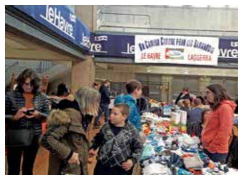
Octobre 2019 : Vide-Grenier au Havre.