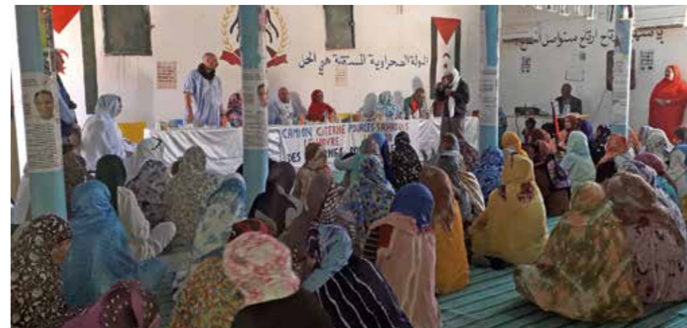
La délégation du Camion Citerne reçue par le Conseil Municipal de Laguera - Février 2020.

L'aspect humanitaire de la présence des enfants sahraouis dans notre région est un moyen important de faire connaître leurs conditions de vie et les raisons politiques de leur exil.