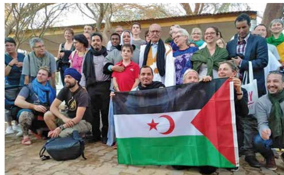
Délégation française en mars 2019 avec le Président Brahim Ghali.

Ivry et Vitry ainsi que le Conseil départemental ont été aux avant-postes de ce soutien depuis de nombreuses années autour du dynamique comité 94 de l'AARASD.